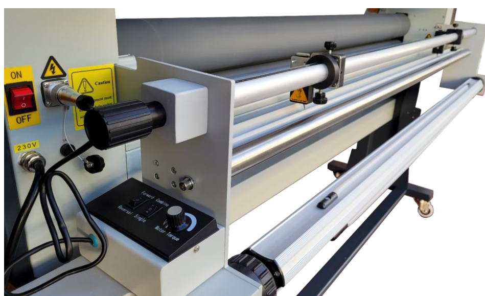
ROLL-TO-ROLL + COLTELLI DI RIFILO LATERALE